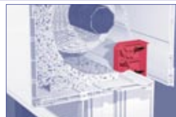
variabilní poloha náběhového prvku